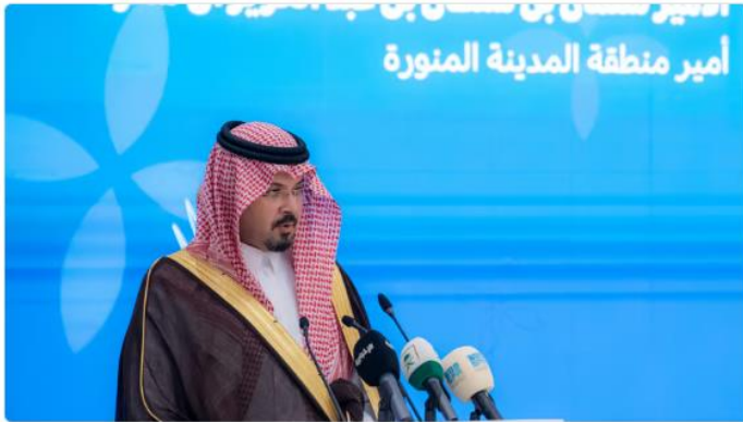
الأمير سلمان بن سلطان بن عبدالعزيز خلال حفل تدشين مستشفى السلام الوقفي

وتشير تلك النتائج بشكل واضح للأدوار التي تقوم بها حكومة المملكة في دعم القطاع غير الربحي، وهذا غير مستغرب بالنظر إلى تعزيز دور هذا القطاع في رؤية المملكة ٢٠٣٠.