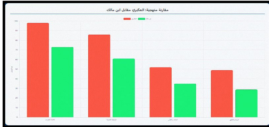
شكل (4): التحليل الكمي للإشكالات النحويّة في إعراب الحديث في كتابي العكبري وابن مالك