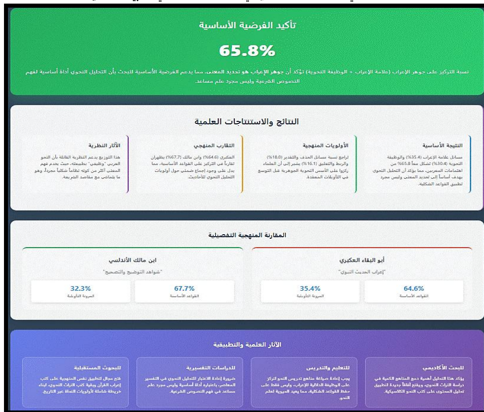
شكل (5): التحليل النحويّ أداة أساسية لفهم النصوص الشرعية والآثار المترتبة على ذلك