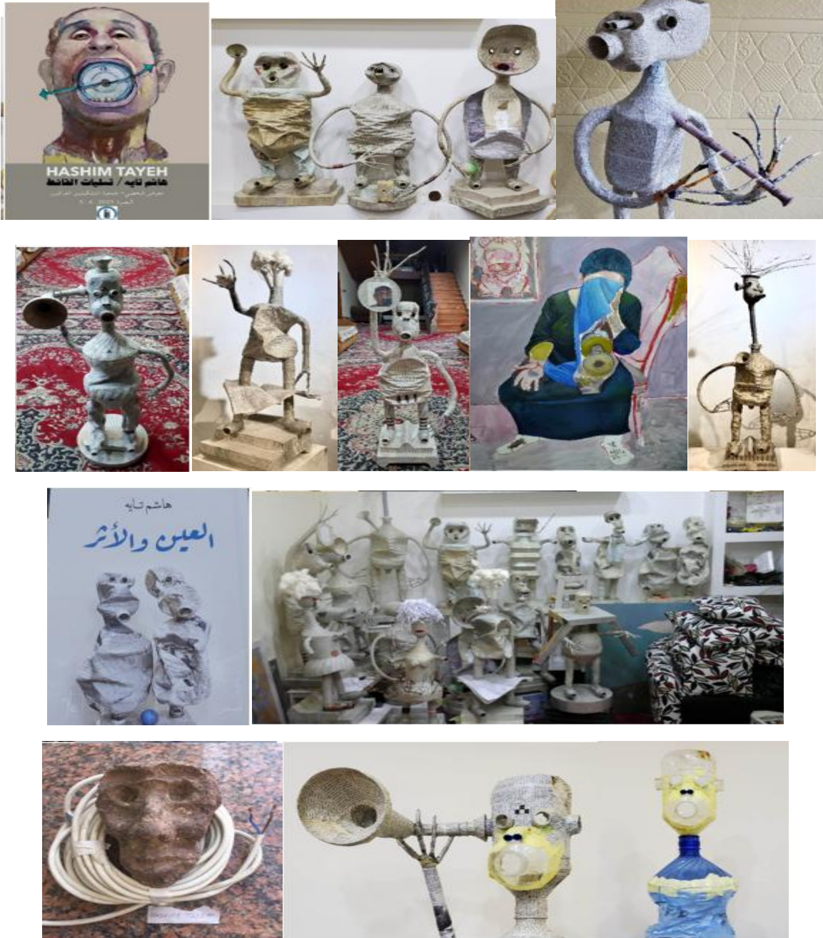
شكل رقم (2): بعض من أعمال الفنان التشكيلي هاشم تايه