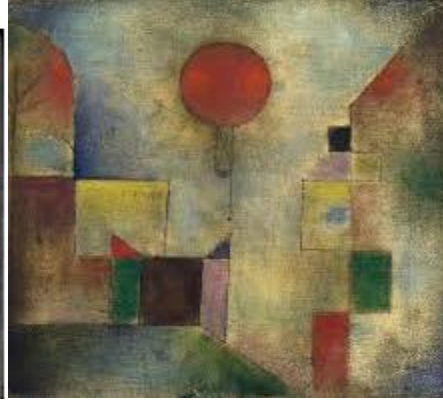
شكل رقم (4): بعض من لوحات الفنان بول كلي