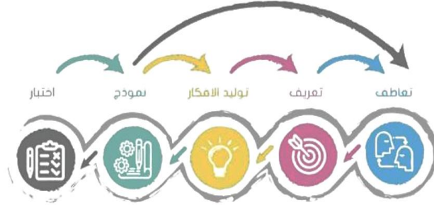
شكل (1):