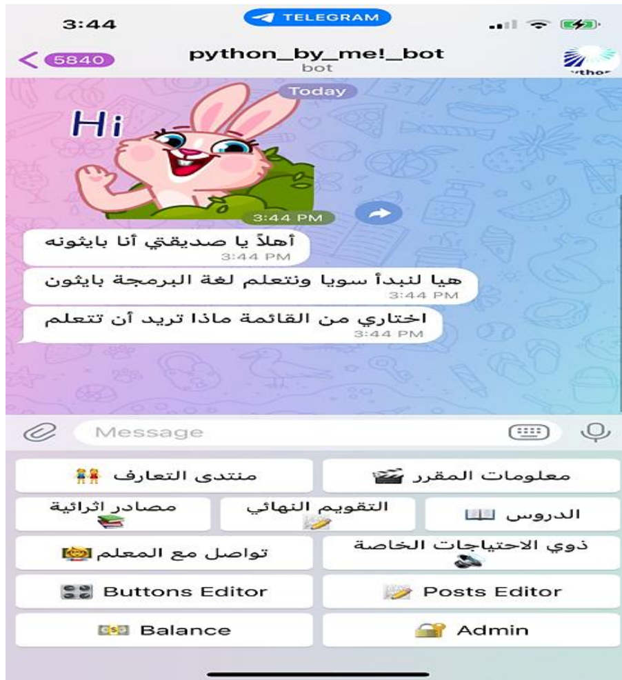
الشكل (٣-٤): واجهة روبوت الدردشة التفاعلي

ويوضح الشكل (٣-٤) الشكل النهائي لواجهة روبوت الدردشة التفاعلي python_by_me!_bot: